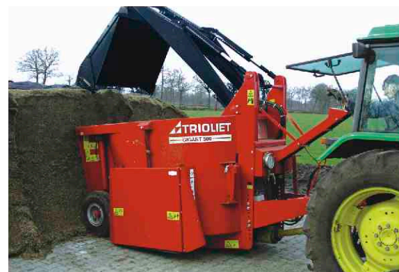
Richtige Höhe der Schnecke im Verhältnis zur Höhe des Mischbe- hälters.