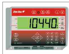
Auf Wunsch lieferbar: Programmierbarer Wiegeindikator EZ 3600 V mit Datenübergabe (Datakey), Docking Station und Futter Management Software.