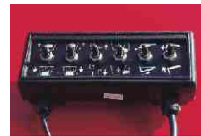
Auf Wunsch lieferbar: Elektrische Fernbedie- nung.