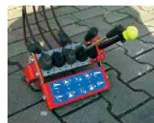
Mechanische Fernbedienung über Bowdenzüge.